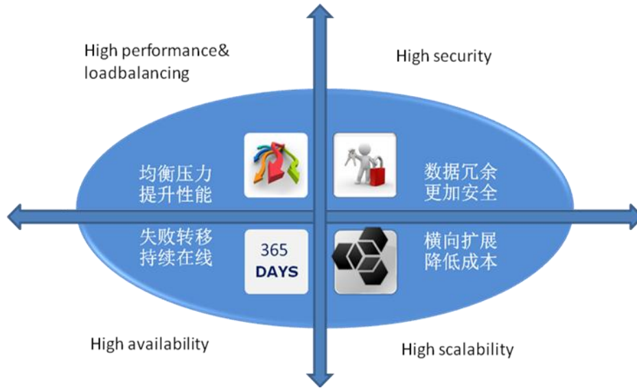
图 2. “一站式” 解决方案